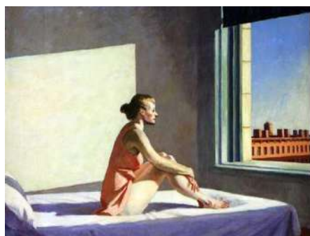
Morning sun, Edward Hopper 1952

In questo quadro astratto si vedono eclissi e pianeti fondersi in colori studiati appositamente e legati tra di loro attraverso l'armonia musicale tipica dell'autore, l'oscurità del dipinto penetra la nostra pelle portandoci in uno stato di coscienza interiore molto profondo, dove il viaggio dentro noi stessi diventa compagno fondamentale di un viaggio fisico.