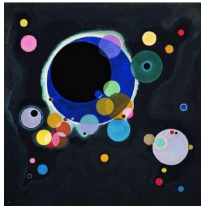
Solomon R. Guggenheim Museum di New York

Chagall, pittore bielorusso naturalizzato francese di origine ebraiche, possedeva una vita dominata dall'amore, egli aveva una vita amorosa fantastica e nei suoi quadri traspare benissimo questo stato d'animo di serenità. L'amore che provava per la sua prima moglie lo faceva viaggiare con leggerezza nel cielo terso sopra alla sua città natale.