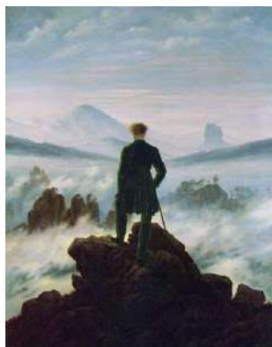
Viandante sul mare di nebbia, Caspar David Friedrich 1818 Hamburger Kunsthalle di Amburgo

Il personaggio, nonostante sia di spalle, ci permette di captare il suo atteggiamento romantico, irrequieto, tormentato dalla ricerca dell'infinito rappresentato dal paesaggio, sembra essere assorto in una sorta di contemplazione interiore e spirituale.