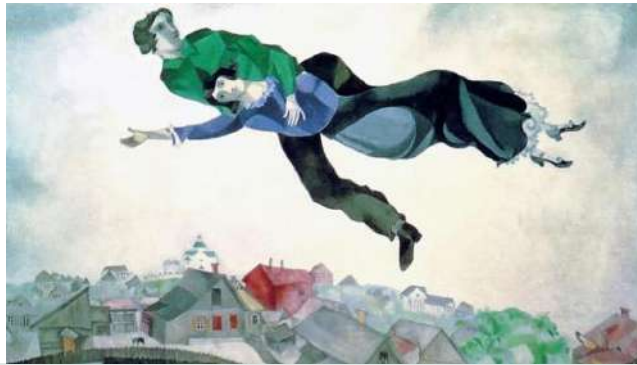
Sopra la città, Marc Chagall 1918 Galleria Tretyakov di Mosca

Chagall, pittore bielorusso naturalizzato francese di origine ebraiche, possedeva una vita dominata dall'amore, egli aveva una vita amorosa fantastica e nei suoi quadri traspare benissimo questo stato d'animo di serenità. L'amore che provava per la sua prima moglie lo faceva viaggiare con leggerezza nel cielo terso sopra alla sua città natale.