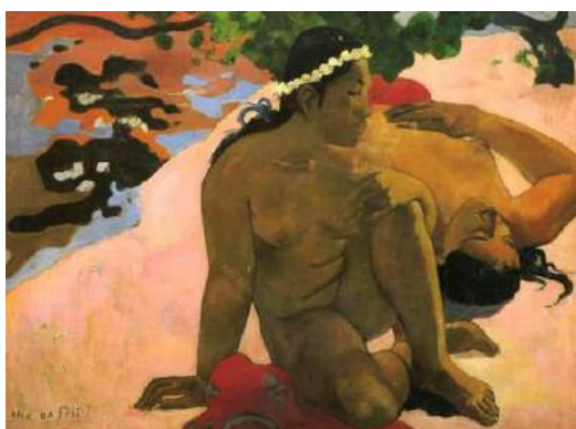
Aha oe feii? (Come, sei gelosa?), Paul Gauguin 1892 Museo Puškin di Mosca.

Il minotauro nella mitologia come il viaggio verso il proprio “mostro” interiore al centro del labirinto da sempre inteso come viaggio iniziatico verso il proprio io.